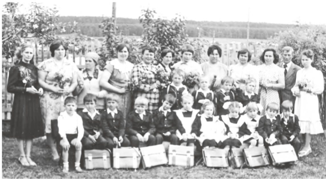
Первый выпуск будущих первоклассников.